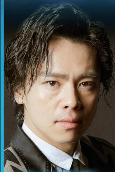
中川晃教 Akinori Nakagawa